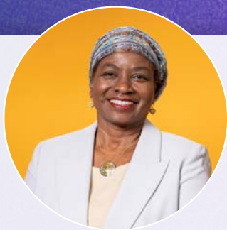
р Наталия Канем, исполнительный директор ЮНФПА

Основные ресурсы являются тем фундаментом, на котором строятся все программы ЮНФПА в 150 странах, ориентированные на то, чтобы никто не остался забытым и чтобы в первую очередь оказать помощь самым обездоленным. Две трети основных ресурсов ЮНФПА направлены на осуществление программы на местах, из оставшейся трети финансируется операционная деятельность, которая обеспечивает возможность реализовать эти программы эффективно.